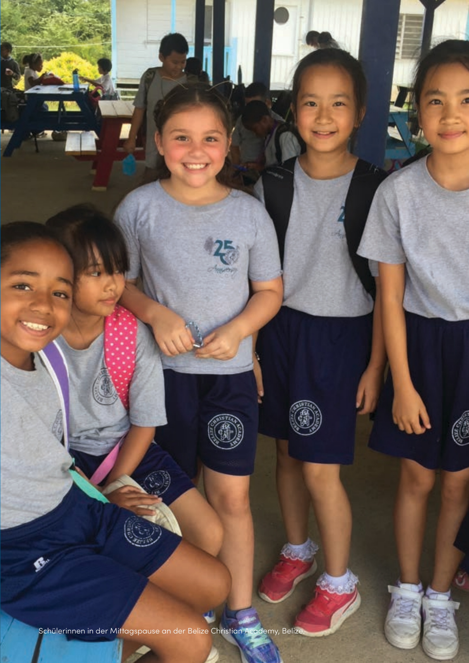
Schülerinnen in der Mittagspause an der Belize Christian Academy, Belize.