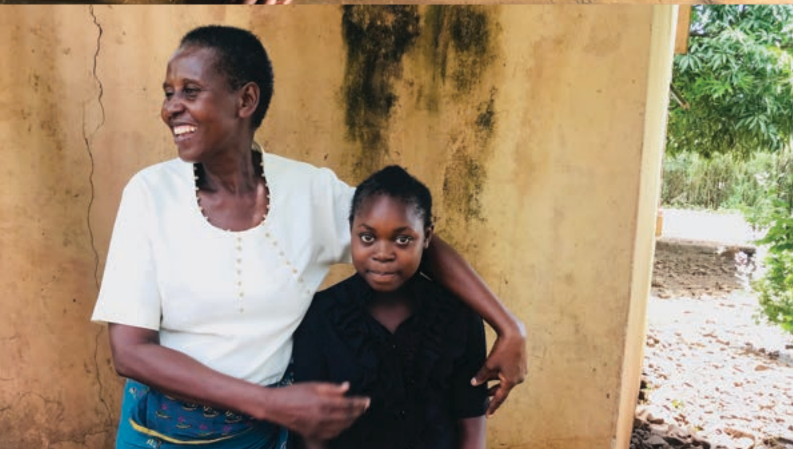
Oben: Schulkinder in Sambia. Unten: Open Schools Tutor mit Schüler in Lusaka, Sambia.