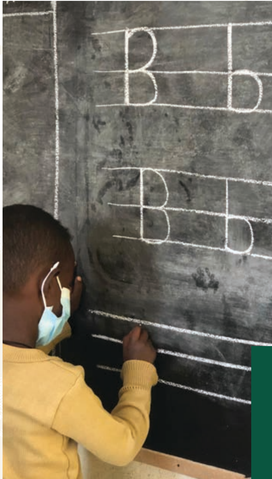
Schüler von Beyond Borders hart bei der Arbeit