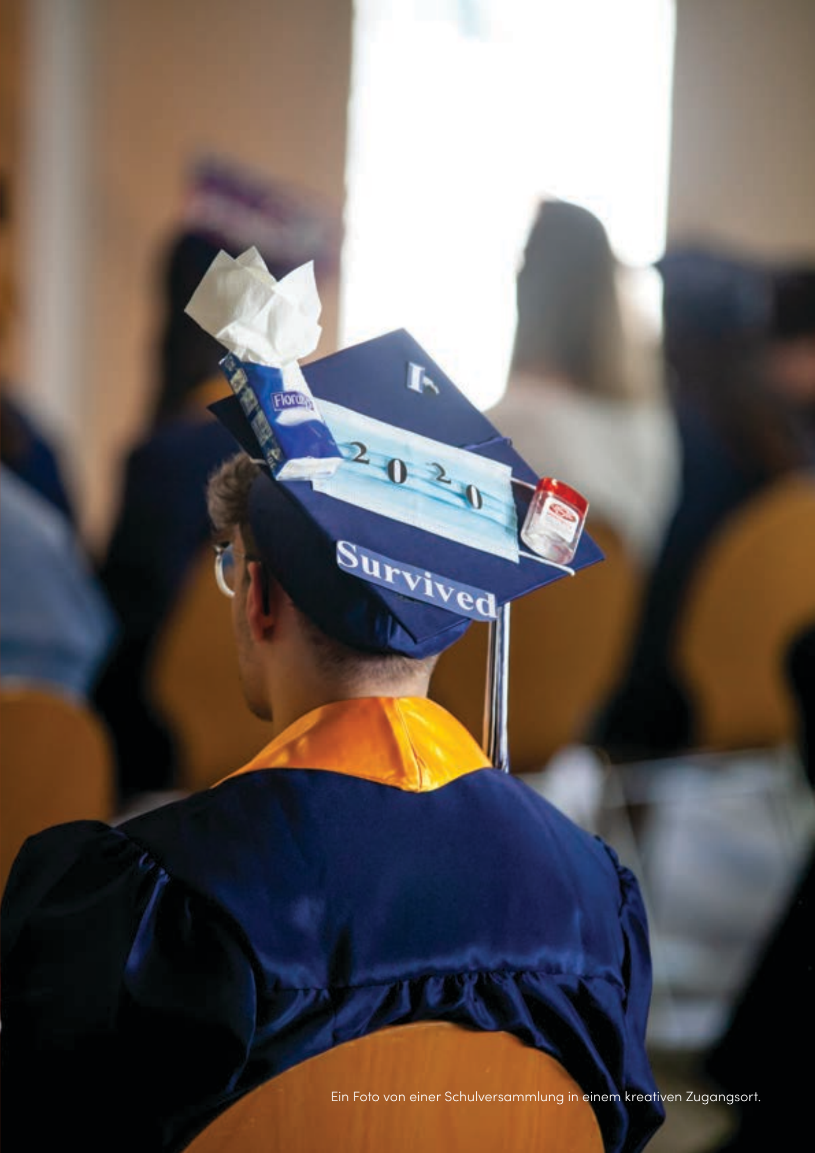
Ein Foto von einer Schulversammlung in einem kreativen Zugangsort.